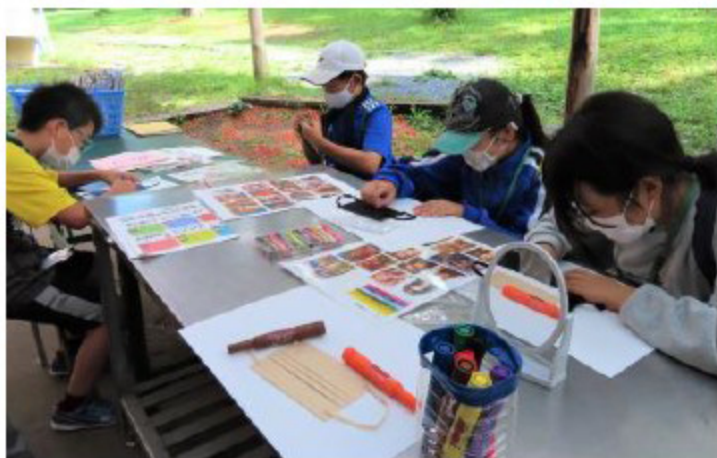
必需品となったマスクにペイント！コロナウィルスなんて吹っ飛んじゃえ！これでキャンプファイヤーへのテンションもUP！！