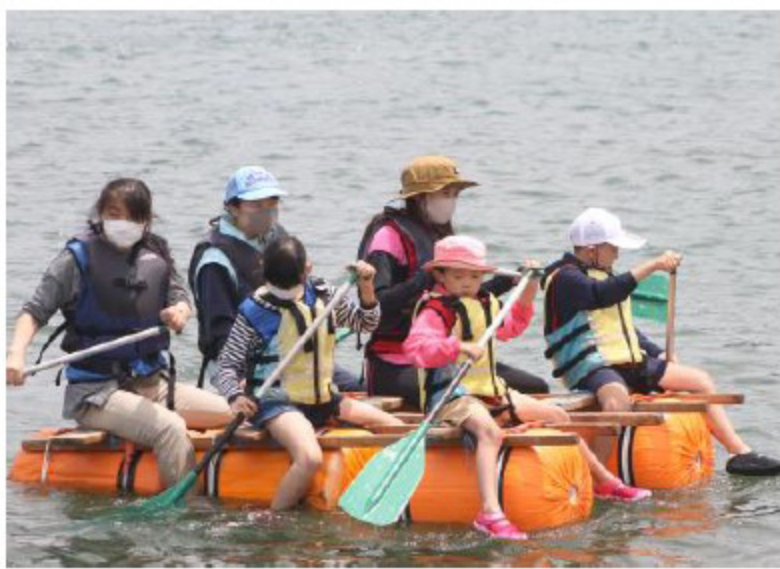
スチロロールいかだで出発！

主催事業「エンジョイ海遊び①」R3.7.4(日) 「エンジョイ海遊び②」R3.7.11(日)