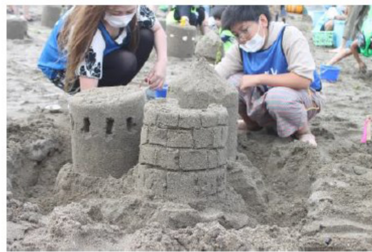
らせん階段が素敵なお城は完成度が高い！！