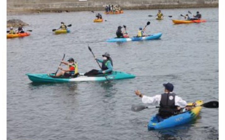
予約殺到！大人気カヌーはやっぱり楽しい！