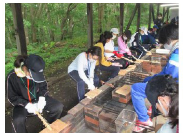
「火」「小刀」。間違えば私たちが脅かすもの。正しく使えば私たちの暮らしを豊かにしてくれるもの。それらとの付き合い方を体験で学びました。