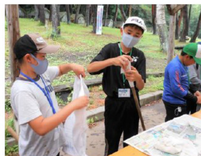
使い古しの布や古新聞を利用し、トーチ棒を作ったよ。難しいところもあったけど大丈夫。みんなで協力してできたよ。