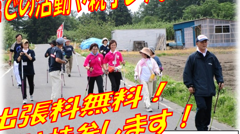
ノルディックウォーキング

公民館・児童館での活動や親子レクなどで好評! 講師料・出張料無料! 道具・材料は持参します!