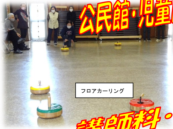
フロアカーリング