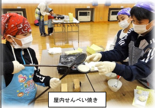
屋内せんべい焼き