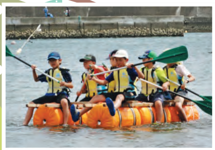
6. スチロバールいかだ