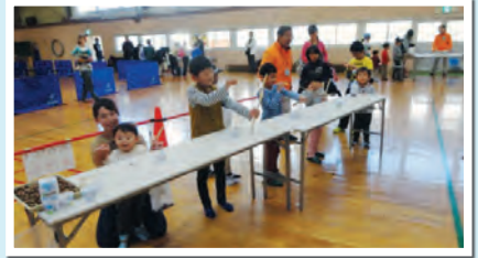
46. 木の実の遊び道具